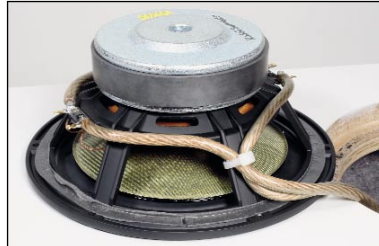
Gelbe Basis: Die Membran des Mitteltöners lässt Burmester aus Kevlar plus Kohlefaser weben.