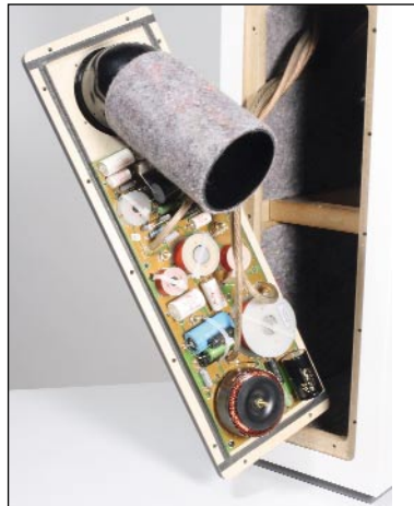
Docking-Station: Die Weiche wird quasi als Modul angedockt – inklusive Bassreflex-Rohr.