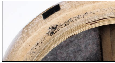
Doppelt besser: Der Korpus der 961 MK3 besteht aus unterschiedlich dichten Faserplatten.